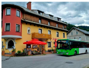
Die öffentliche Anreise mit Bus und Bahn – ideal für Bergtouren. Steininger