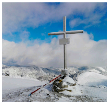
Am Gipfel des 1.682 m hohen Turnauer Hochanger.